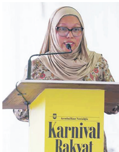
Firdaus ketika berucap di majlis perasmian Karnival Rakyat Karangkraf, pada Jumaat.

SHAH ALAM - Karnival Rakyat Karangkraf yang berlangsung tiga hari bermula Jumaat mencerminkan kekayaan dan kepelbagaian kaum di negara ini.